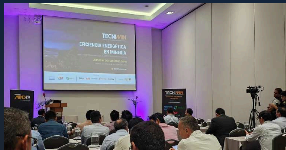
MARCA EN PANTALLA