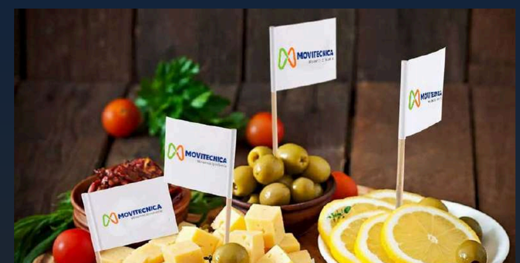
MARCA COCKTAIL/COFFEE BREAK