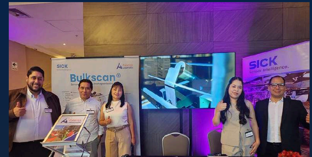
MESA DE EXHIBICIÓN